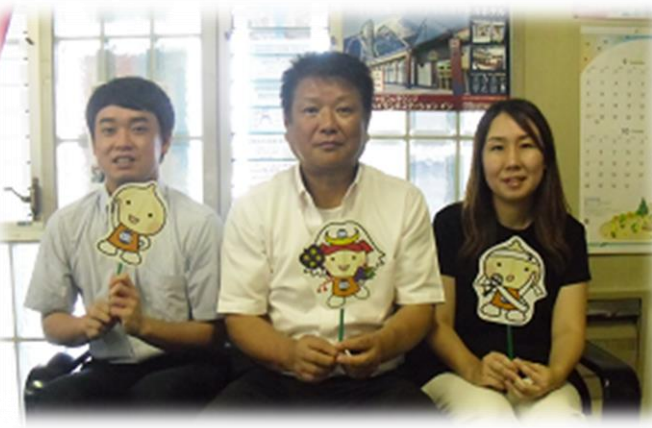
左から：小池書記長・堀内執行委員長・清水書記

組合員への資産形成促進の独自取り組みについて、 富士急行労働組合にお聞きしました。