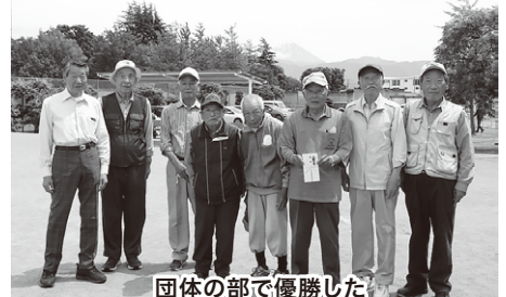
団体の部で優勝した自治体山梨県職員退職者会のみなさん

現退一致の考え方にに基づき、連合山梨からも現役チームが参加し、OBの方々と交流を深めました。