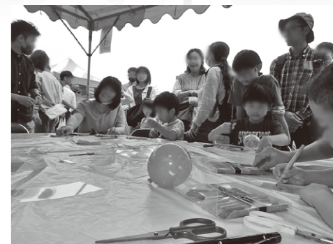
プラ板を使ってみんなで工作