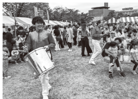
会場を駆け回るパフォーマンスに大盛り上がり