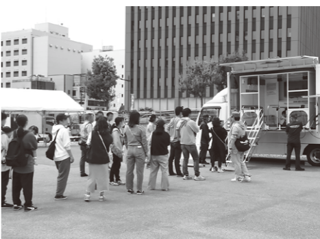
起震車に乗って大震災クラスの揺れを体験