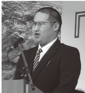
メーデースローガンおよびメーデー宣言を読み上げる青年委員会 諏訪委員長