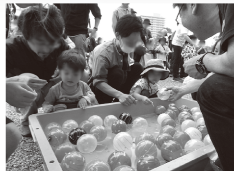
ヨーヨー釣れるかな

「働くことを軸とする安心社会」の実現に向けて、組織を越えた組合員の交流や、組合員と関係団体がひとつとなる有意義なメーデーとなりました。