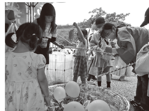
やったー！お菓子釣れたよ