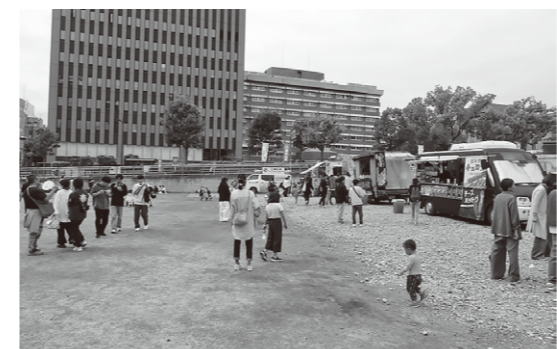
南芝生広場にはキッチンカーが集結