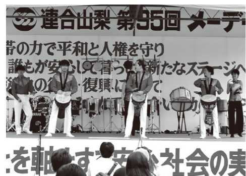
ステージ上で演奏するファンカッションの皆さん