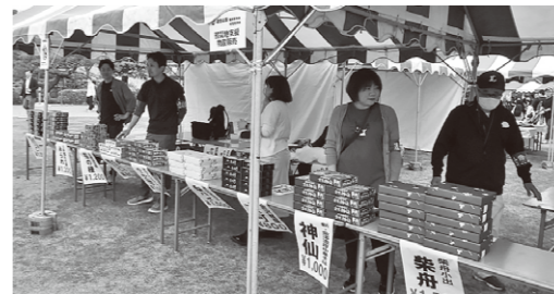
↑ 被災地支援物産販売も好評でした ↓