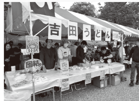
ご当地名物の吉田のうどん

祭典では、打ち上げ花火の号砲を合図に、それぞれの構成組織が担当する模擬店をオープンさせると、あっという間に大盛況となりました。